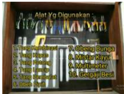
Gambar. 3. Tampilan Penjelasan Materi

Tampilan ketiga yakni bagian langkah kerja memuat gambar wiring diagram yang nanti akan kita rangkai, pada bagian ini juga dijelaskan langkah-langkah pengerjaan dalam melakukan praktikum sesuai petunjuk kerja pada jobsheet praktikum instalasi perumahan. Dalam langkah kerja memiliki durasi 10,40 menit, seperti yang ditunjukkan dalam gambar 4. Pada bagian ini penjelasan tentang langkah-langkah pembuatan instalasi perumahan mulai dari bagaimana pemasangan APP sampai dengan penyaluran listrik ke beban yang di tuju baik itu berupa lampu atau peralatan elektronik lainnya yang tersambung pada stop kontak rumah. Selain itu pada bagian ini juga di jelaskan keselamatan dan kesehatan kerja (K3) sehingga mahasiswa dapat mengetahui bahaya dalam pengerjaan instalasi perumahan. Keempat ini merupakan tampilan hasil kerja, setelah melakukan proses pengerjaan sesuai langkah-langkah kerja yang jelaskan dalam video tutorial mendapatkan hasil pemasangan rangkaian sesuai dengan video yang ditampilkan, seperti yang di perlihatkan dalam gambar 5. Setelah pembuatan video tutorial ini selesai maka di lakukanlah penilaian validitas oleh para ahli dan penerapan dalam proses pembelajaran untuk mengetahui praktikalitas pemakaian media pembelajaran yang dikembangkan.