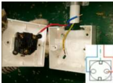
Gambar. 4. Tampilan Langkah Kerja

Tampilan ketiga yakni bagian langkah kerja memuat gambar wiring diagram yang nanti akan kita rangkai, pada bagian ini juga dijelaskan langkah-langkah pengerjaan dalam melakukan praktikum sesuai petunjuk kerja pada jobsheet praktikum instalasi perumahan. Dalam langkah kerja memiliki durasi 10,40 menit, seperti yang ditunjukkan dalam gambar 4. Pada bagian ini penjelasan tentang langkah-langkah pembuatan instalasi perumahan mulai dari bagaimana pemasangan APP sampai dengan penyaluran listrik ke beban yang di tuju baik itu berupa lampu atau peralatan elektronik lainnya yang tersambung pada stop kontak rumah. Selain itu pada bagian ini juga di jelaskan keselamatan dan kesehatan kerja (K3) sehingga mahasiswa dapat mengetahui bahaya dalam pengerjaan instalasi perumahan. Keempat ini merupakan tampilan hasil kerja, setelah melakukan proses pengerjaan sesuai langkah-langkah kerja yang jelaskan dalam video tutorial mendapatkan hasil pemasangan rangkaian sesuai dengan video yang ditampilkan, seperti yang di perlihatkan dalam gambar 5. Setelah pembuatan video tutorial ini selesai maka di lakukanlah penilaian validitas oleh para ahli dan penerapan dalam proses pembelajaran untuk mengetahui praktikalitas pemakaian media pembelajaran yang dikembangkan.