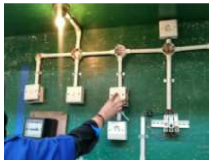
Gambar. 5. Tampilan Hasil Kerja

Validitas media pembelajaran diperoleh tanggapan validator tentang kevalidan produk. Media pembelajaran yang akan di validasi oleh para ahli. Validator terdiri dari dua orang dosen jurusan Teknik Elektro Universitas Negeri Padang. Hasil dari validitas media dapat dilihat pada tabel 5. Berdasarkan hasil yang didapatkan dalam tabel 5 maka dapat diketahui bahwa nilai validitas yang didapatkan adalah sebesar 94% untuk validator 2 dan 86% untuk validator 1. Jika hasil penilaian validator 1 dan validator dua di rata-ratakan maka nilai validitas yang didapatkan adalah sebesar 90%. Dengan demikian jika hasil ini di interpretasikan ke dalam tabel 3 maka dapat diketahui bahwa media pembelajaran video tutorial termasuk dalam kriteria sangat valid digunakan dalam pembelajaran instalasi perumahan. Sehingga dari hasil ini dapat di ketahui bahwa dari sudut pandang ahli pembelajaran instalasi perumahan media pembelajaran video tutorial sangat valid digunakan dalam proses pembelajaran instalasi perumahan di Jurusan Teknik Elektro, Fakultas Teknik, Universitas Negeri Padang.