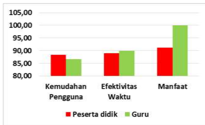
Gambar. 3. Grafik praktikalitas Media Pembelajaran

Setelah media pembelajaran berbasis android dinyatakan valid oleh validator, selanjutnya produk yang dihasilkan akan diuji coba untuk menentukan praktikalitas media pembelajaran berbasis android terhadap guru mata pelajaran IML dan 20 peserta didik kelas XI TITL SMK N 5 Padang. Hasil praktikalitas yang dilakukan diperoleh rata-rata nilai praktikalitas peserta didik sebesar 89,42% dengan kategori praktis. Hasil praktikalitas oleh guru mata pelajaran diperoleh nilai praktikalitas sebesar 91,67% dengan kategori sangat praktis. Dari hasil rata – rata praktikalitas yang diperoleh dapat dilihat pada gambar 3 grafik praktikalitas setiap aspek penilaian praktikalitas, adapun aspek yang dinilai yaitu kemudahan pengguna, evektifitas waktu, dan manfaat.